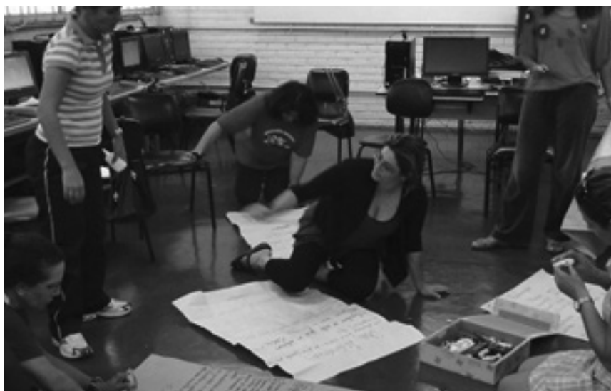
FIGURA 2 – PROFESSORES DURANTE O CURSO DE FORMAÇÃO CONTINUADA EM MÍDIA-EDUCAÇÃO